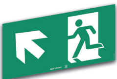
LS60/FHG Flèche en haut à gauche