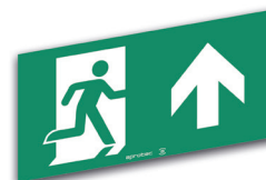
LS60/FH Flèche en haut