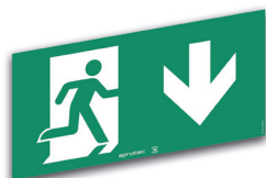
LS60/FB Flèche en bas