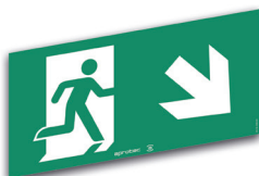
LS60/FBD Flèche en bas à droite