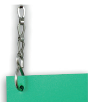
CHAINE/M Chaînette de suspension