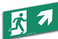
LS60/FHD Flèche en haut à droite