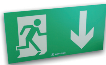
LF60/FB Flèche en bas