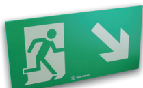
LF60/FBD Flèche en bas à droite