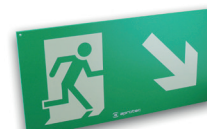
LF60/RV/FDB Recto verso Flèches diago. en bas