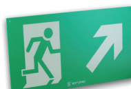
LF60/RV/FDH Recto verso Flèches diago. en haut