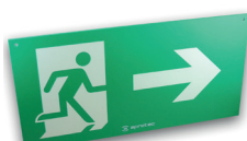
LF60/RV/FHO Recto verso Flèches horizontales