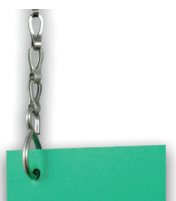
CHAINE/M Chaînette de suspension