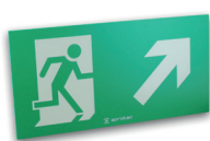
LF60/FHD Flèche en haut à droite