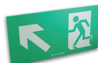
LF60/FHG Flèche en haut à gauche