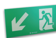
LF60/FBG Flèche en bas à gauche