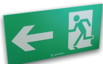
LF60/FG Flèche à gauche