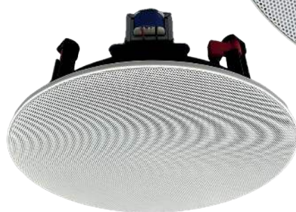
Bande passante et impédance